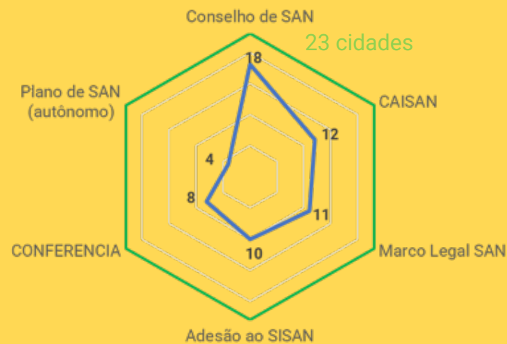
LUPPA 1a edição: 23 cidades